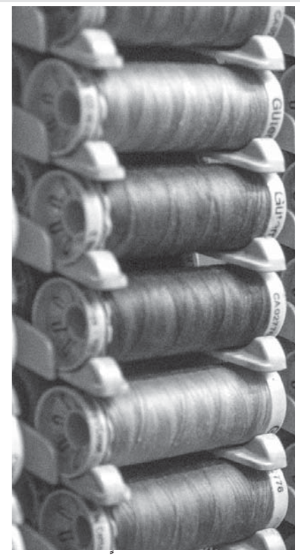
پوشاک در خارج از کشور، عمدتا از طریق «ابتکار کمربند و جاده» ادامه خواهد داد.

بر اساس گزارش شورای ملی نساجی و پوشاک چین، سرمایه گذاری خارجی چین در بخش نساجی و پوشاک از سال ۲۰۱۵ تا ۲۰۲۰ بیش از ۶/۷میلیارد دلار بوده است که از این بین نزدیک به ۱/۸میلیارد دلار (۲۶/۶٪) به کشورهای همسایه جنوب شرقی آسیا مانند ویتنام، کامبوج، تایلند، لائوس و میانمار یرداخت شد.